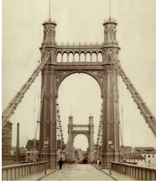
Průhled mostem Františka Josefa I. k Novému Městu patrně v době jeho dokončení roku 1868 View through Franz Joseph Bridge towards the New Town of Prague probably close to the time of its completion in 1868

Students and the fighting ‘Amazon’ on a barricade in today’s Malé Square on 13 June 1848, Bedřich Anděl according to František Roscher, hand-coloured lithograph