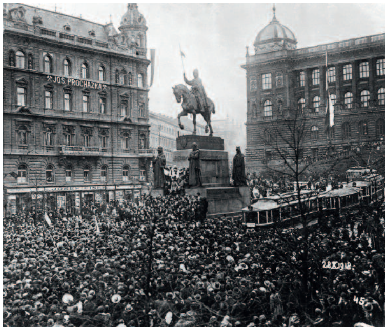
Zástup lidí u sochy sv. Václava se vztyčenou československou vlajkou, 28. října 1918 Line of people near the statue of Saint Wenceslas with the raised Czechoslovak flag, 28 October 1918

The bridge with remarkable Tudor Gothic style architecture appertained to the set of transport structures that disengaged Prague from its medieval appearance and turned it into a modern well-connected urban area.