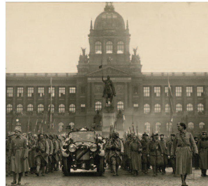
T. G. Masaryk ve společnosti slavnostního průvodu na Václavském náměstí T.G. Masaryk, accompanied by a ceremonial procession, in Wenceslas Square

The exhibition presents the cardinal moments of seven decades during which Prague was transformed significantly from a provincial town into a modern metropolis. Furthermore, visitors may learn about the dramatic events of that time, mainly the Pentecostal Uprising and the street fights which erupted in June 1848 and which are depicted in the realistic images from the museum’s collection. The historical maps and primarily photographs illustrate the overall development of Prague at the end of the ‘prolonged’ 19th century as well as the dramatic change of the life of Prague citizens during the Great War. The wartime period continues with the series of historical photographs and prints featuring the emotional atmosphere in the streets of Prague on the threshold of the independent state. The exhibition guides visitors through the events leading to the declaration of Czechoslovakia and the public manifestations. The turbulent time was also characterised by the return of the political representatives to their motherland, namely Karel Kramář (in November 1918) and Tomáš G. Masaryk (in December 1918).