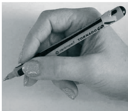
(S) správné držení – špetkový úchop