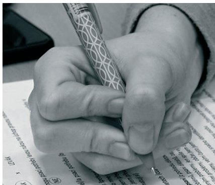
(N2) nesprávné držení – podkládání čtvrtým prstem (příklad – křečovitě držení)