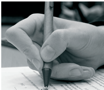
(N3) nesprávné držení – nestandardní postavení (příklad – vařečkový úchop)