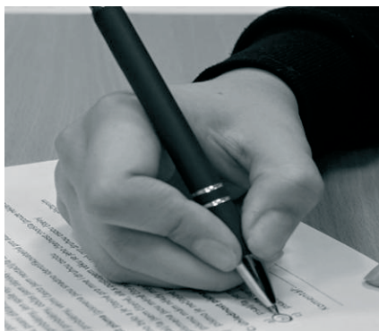
(N1) nesprávné držení – podkládání třetím prstem (příklad – křečovitě držení)