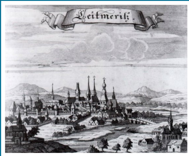
Älteste Abbildung von Leitmeritz, sog. Elbeprospekt, nach: Jakob von Sandrart, Bohemia in suas partes geograph. distinc., Nürnberg 1666

Die internationale Tagung greift aktuelle Forschungsfragen zur Hybridität chronikalischer Texte auf: Wie eigenständig sind die Narrative städtischer Geschichtsschreibung bzw. wie betten sie sich in überstädtische, in regionale Narrative ein? Wie verbinden sich Stadt- und Landesgeschichte in Gründungs- und Herkunftsgeschichten, und wie gestaltet sich die Wahrnehmung des Miteinanders von Stadt und Land in den Aufzeichnungen der zeitgenössischen Chronisten? Eine weitere Frage ist, ob sich anhand der Überlieferung städtischer Chronistik verfolgen lässt, ob und wie Darstellungsmuster der Landeschronistik bzw. Landesbeschreibung aufgegriffen und an die städtischen Verhältnisse adaptiert wurden.